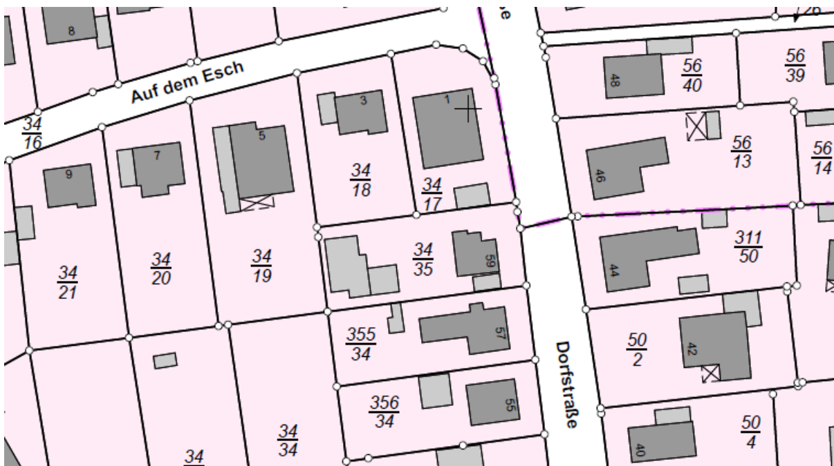
Lageplan des Gebiet; Fokus auf Flurstück 34/17 mit >0,2 bebauter Fläche