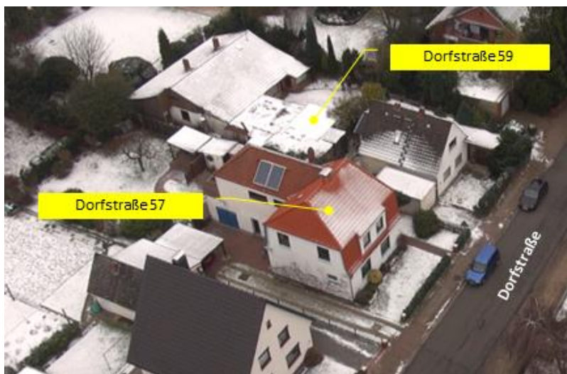
Luftaufnahme aus Süd-Ost