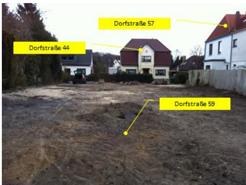
Aufnahme aus West