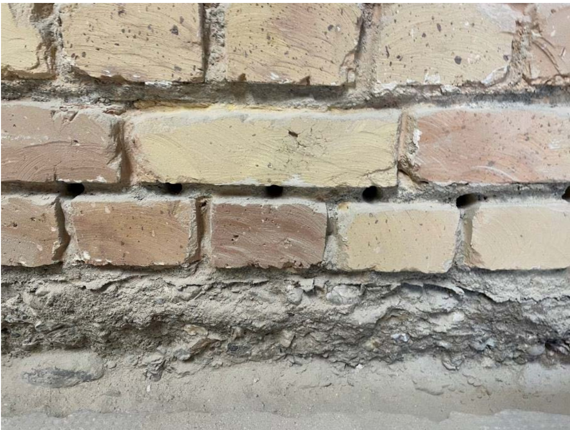
Bohrlochreihe für neue Horizontalsperre